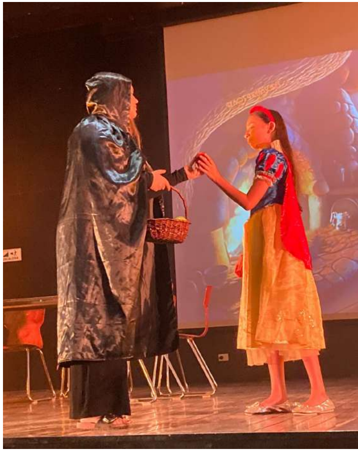
Nota por Charlotte Bienk, Voluntaria de Kulturweit

El proyecto no solo desarrolló las competencias lingüísticas de los estudiantes, sino que también fue un momento divertido que reforzó la cohesión y la alegría del intercambio cultural entre Alemania y Colombia. Un ejemplo vivo de educación internacional y de la alegría del teatro.