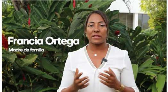
Prevención del Acoso y la Intimidación Escolar