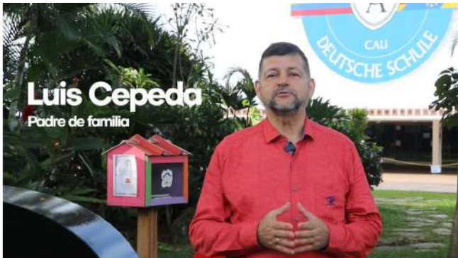
Prevención del Acoso y la Intimidación Escolar